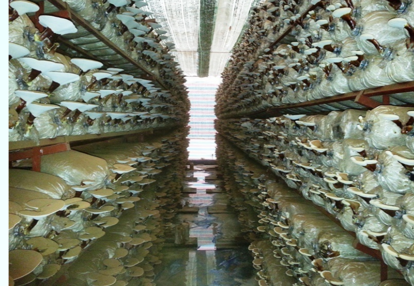
Nấm Linh Chi trồng trên mặt dứa