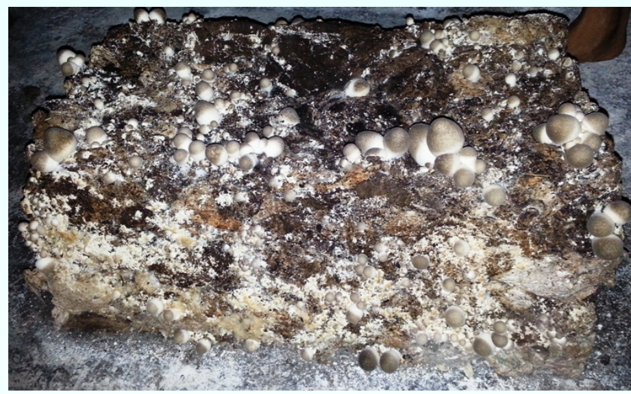
Nấm rơm trồng trên bông thài