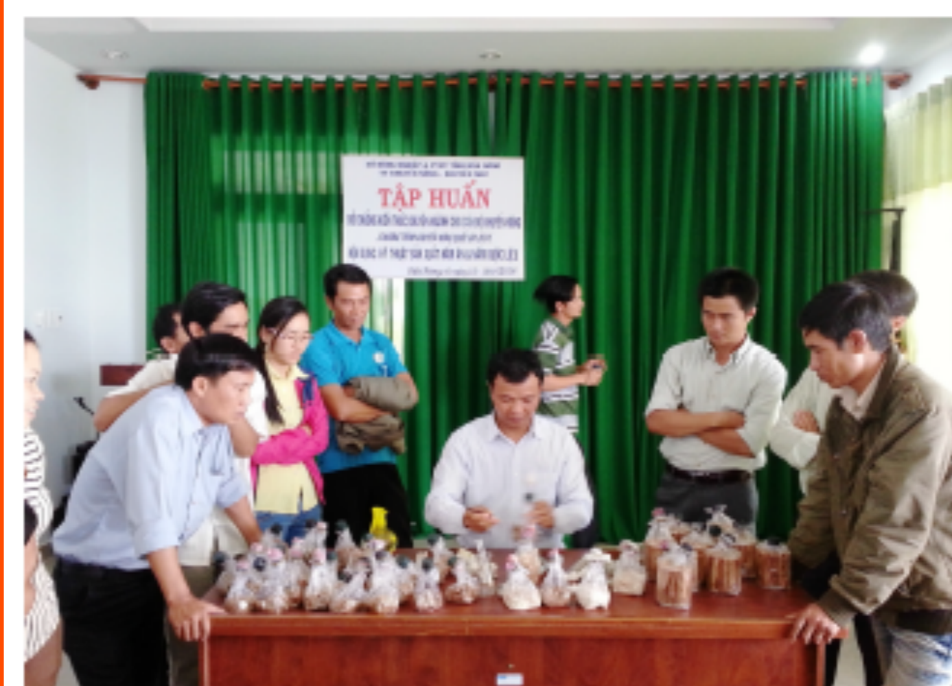
Tập huấn kỹ thuật trồng nấm cho cán bộ khuyến nông tỉnh Đắk Nông