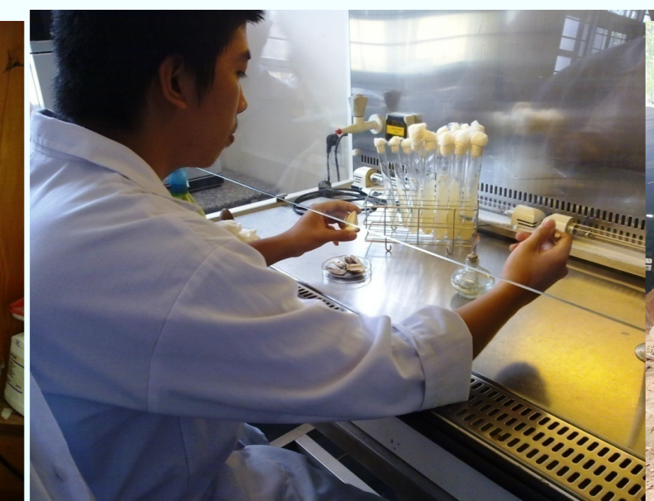
Phân lập giống