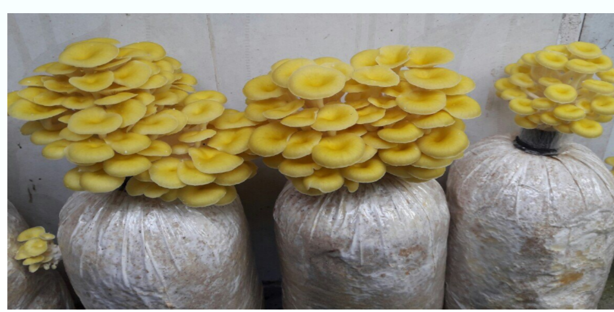
Nấm Bào ngư Kim Đinh