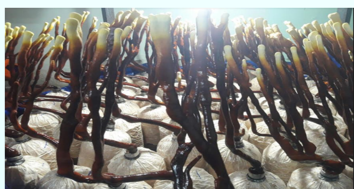
Nấm Linh chi sừng hươu