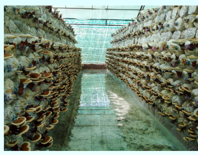
Nấm Linh Chi trồng trên bã mía