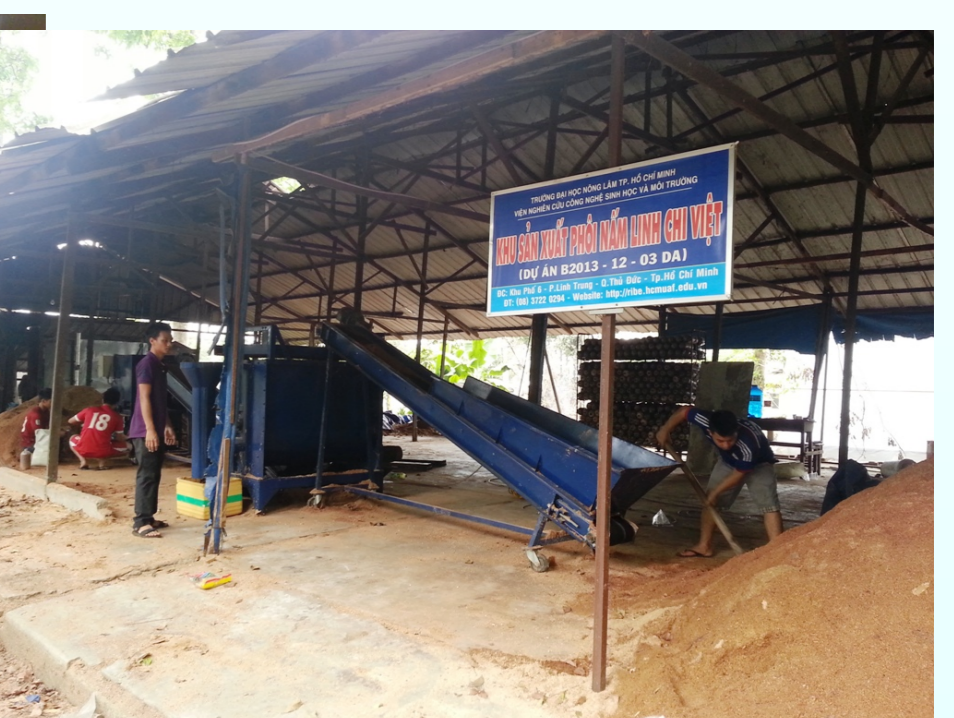
Hệ thống đóng bịch phối nấm