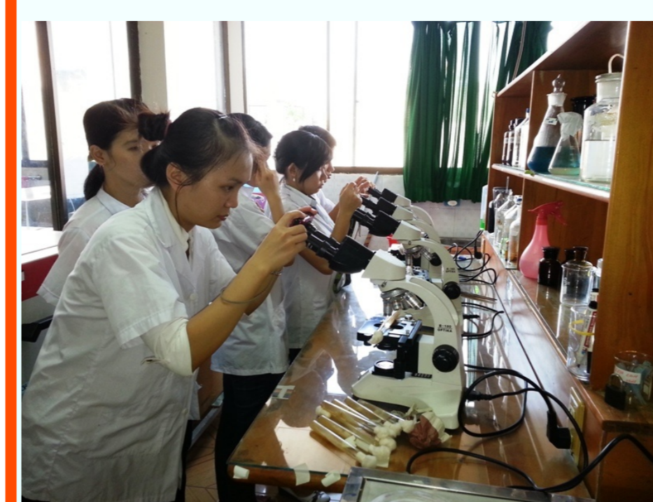
Quan sát sợi nấm