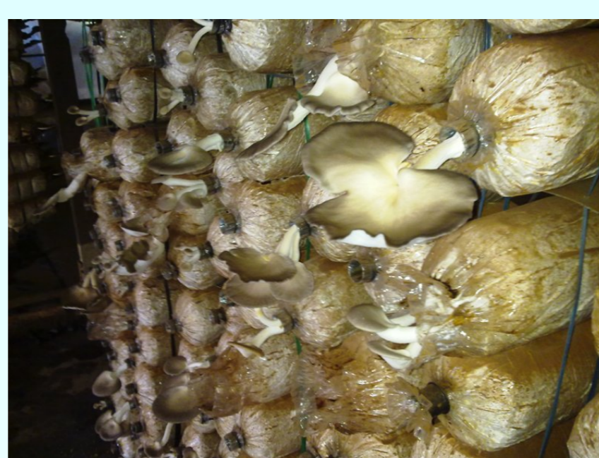
Nấm Bào ngư trồng trên bã mía