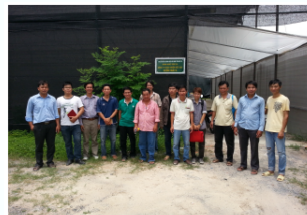
Tập huấn kỹ thuật trồng nấm tại Công ty TNHH Vườn MAYA