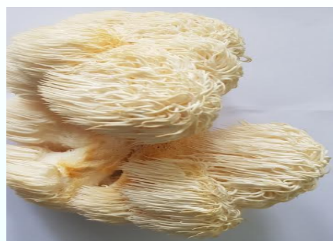
Nấm hầu thủ