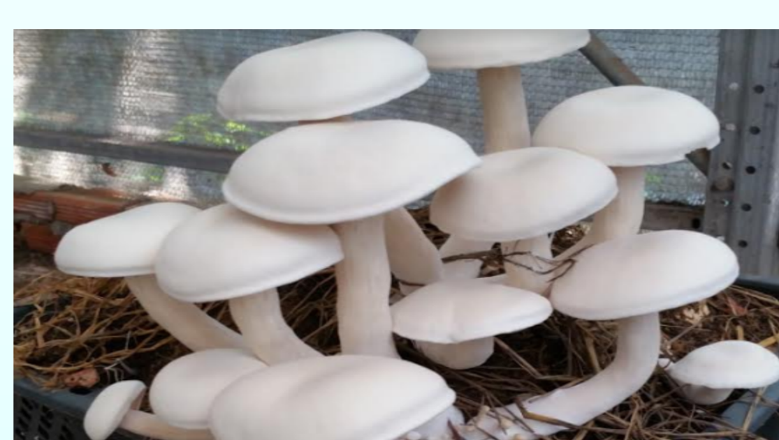
Nấm kim phúc