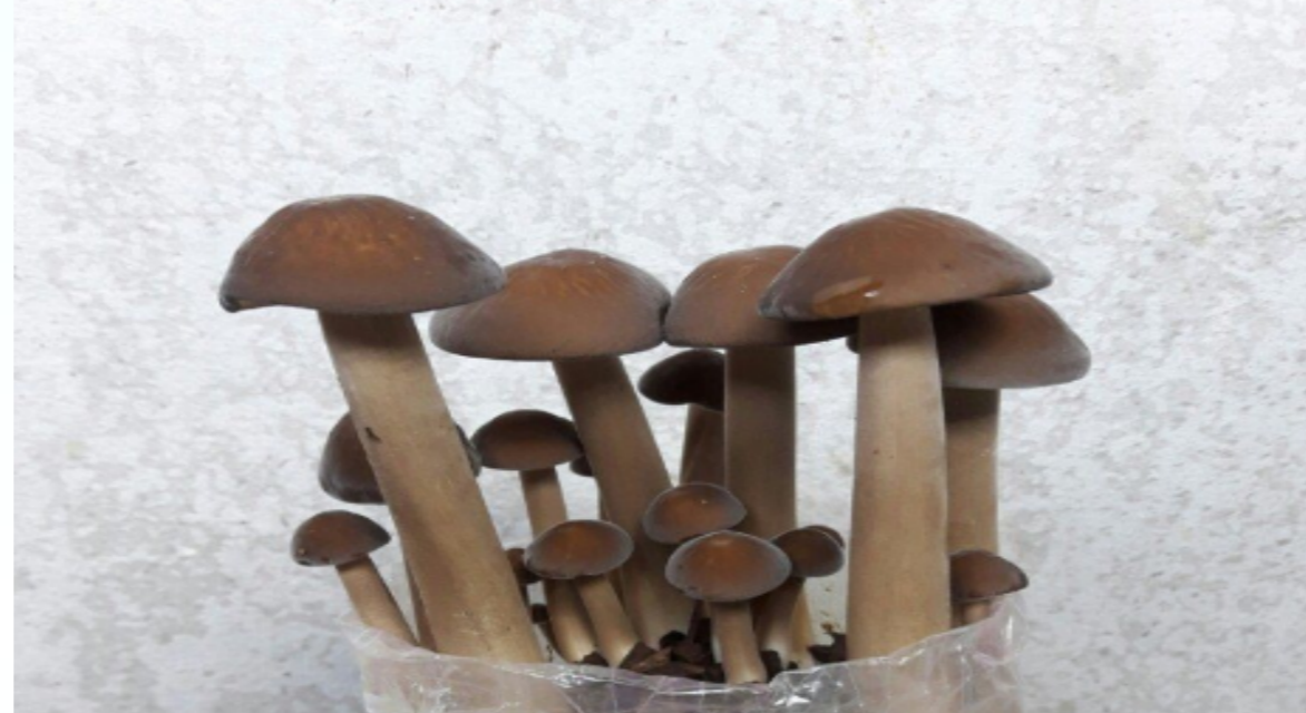
Nấm mốc đen