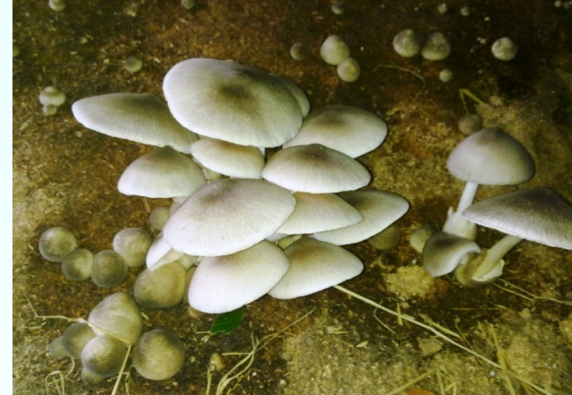
Nấm rơm trồng trên mặt cưa