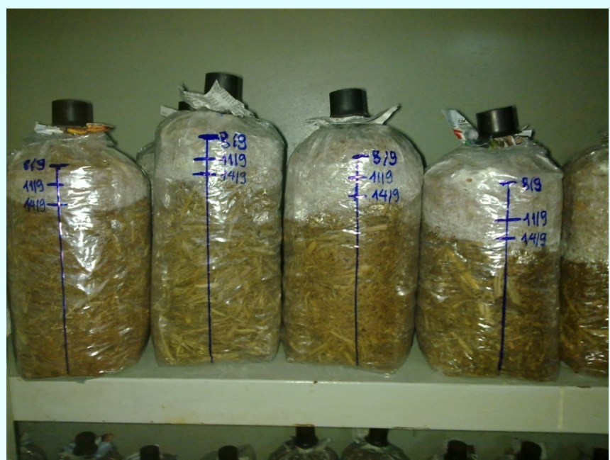
Sử dụng bã mía trồng nấm Linh Chi và Bào ngư