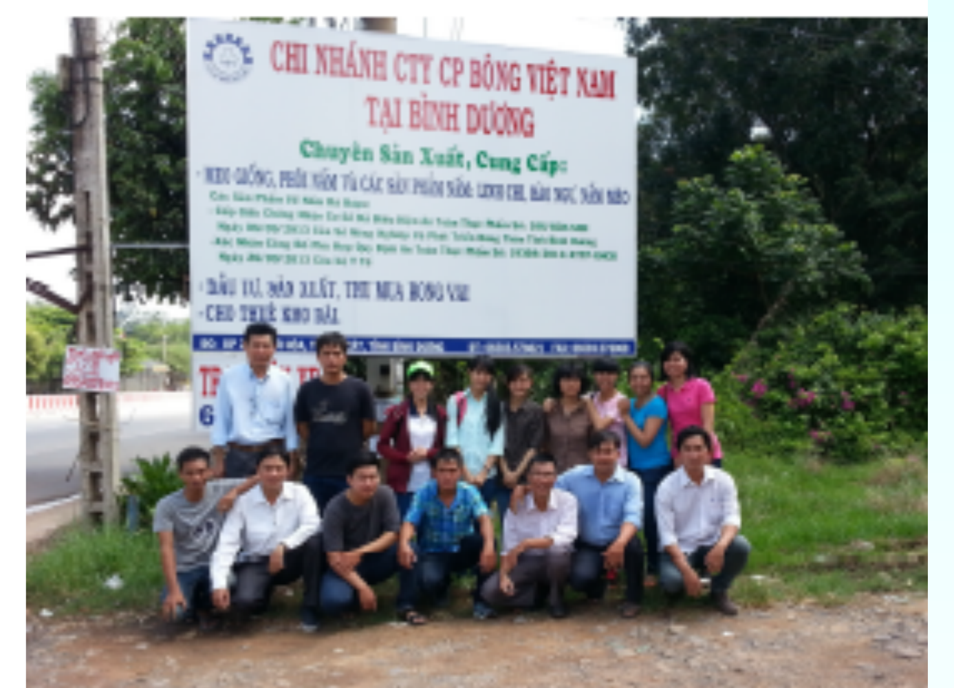
Tập huấn kỹ thuật trồng nấm tại Công ty CP Bông Việt Nam